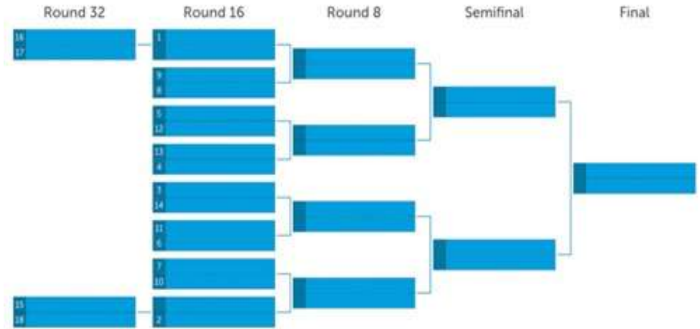
Tableau des points attribués suite au Seeding Round et le tableau d'élimination directe pour la ½ finale puis pour la finale

Tableau d'élimination directe : en fonction du positionnement lors du seeding round ou tour de classement :